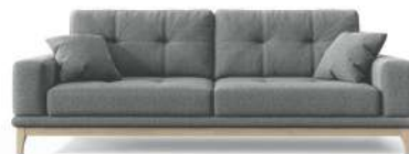
Диваны – кровати